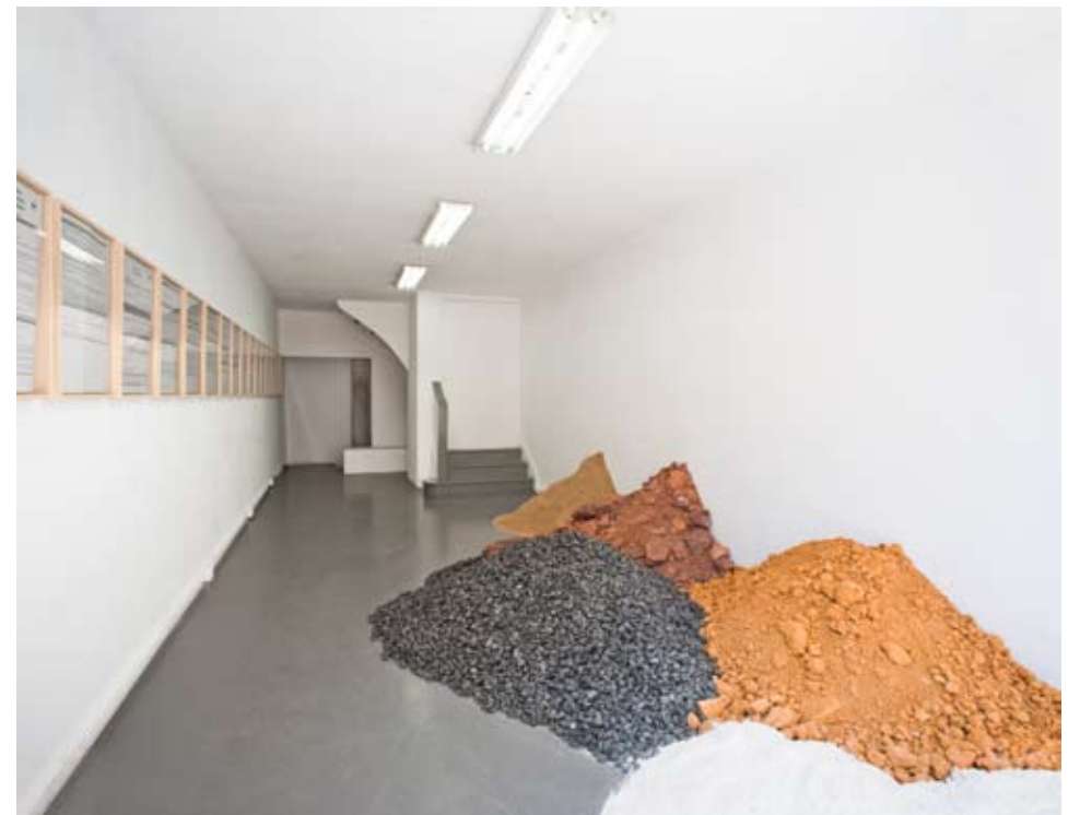
Le champ des possibles