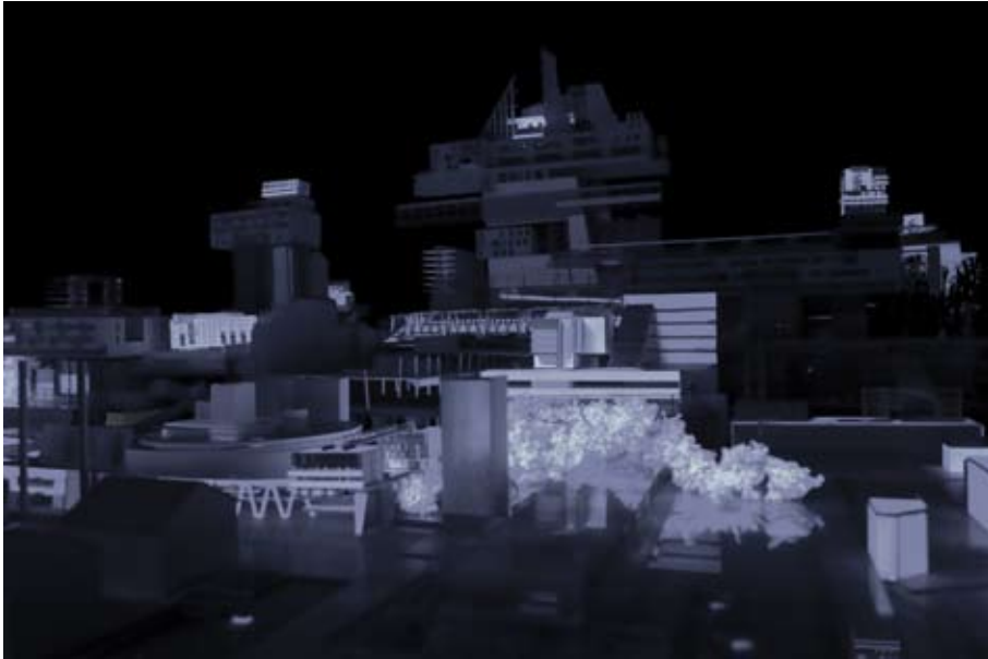
Tout ce que nous ne construirons pas