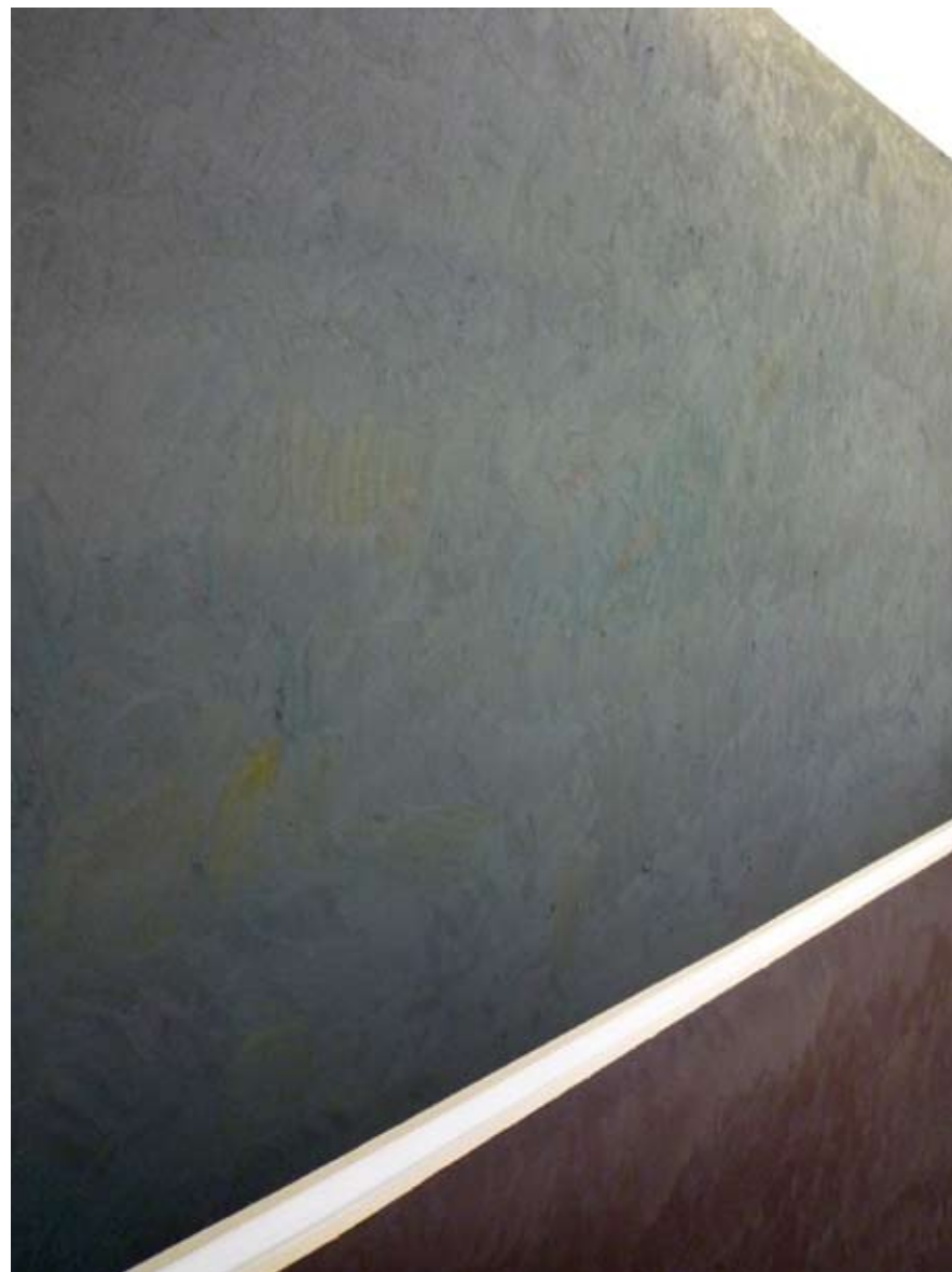
The colorful world of, travail en cours

Catalogue des expositions des Artistes Contemporains Iconais, Auxerre, Mai 1996.