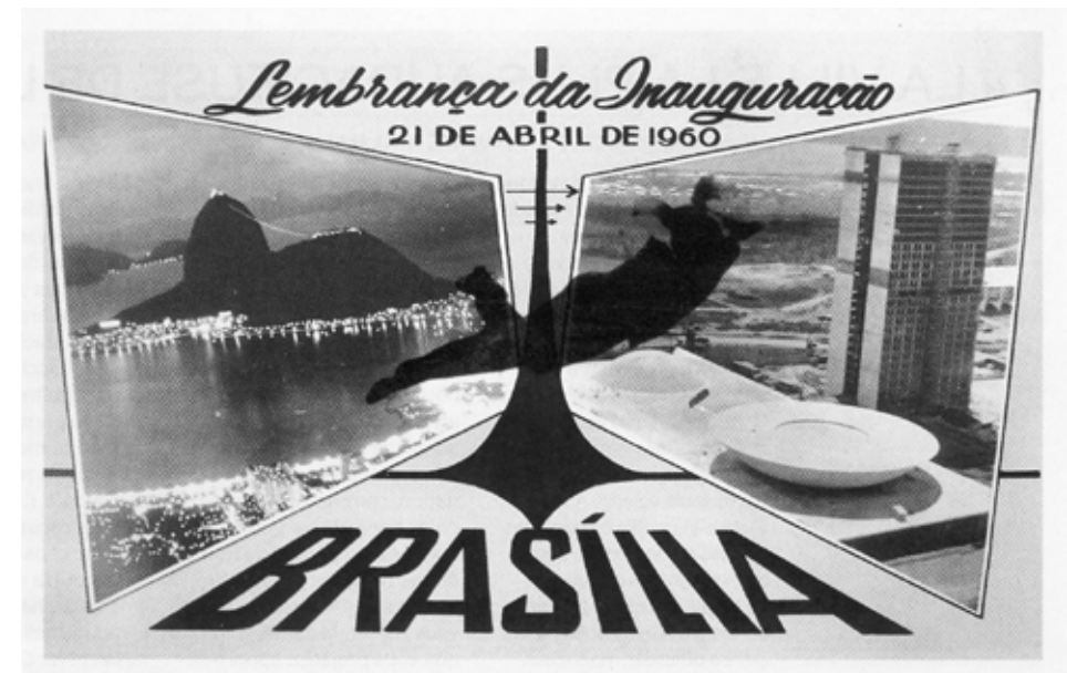
1960. Saut dans le vide. Impression jet d'encre sur coupure de presse (Le Monde magazine n°30 du 10 avril 2010). 14 cm x 9 cm.

2008. PBC#3, workshop, MAMCO Musée d'art moderne et contemporain, Genève. 2007. PBC#2, workshop, MAC/VAL, Vitry sur Seine. 2006. PBC#1, workshop, CNAC Centre Pompidou, Paris. Trafic graphique, Nuit des musées, Centre Pompidou, Paris.