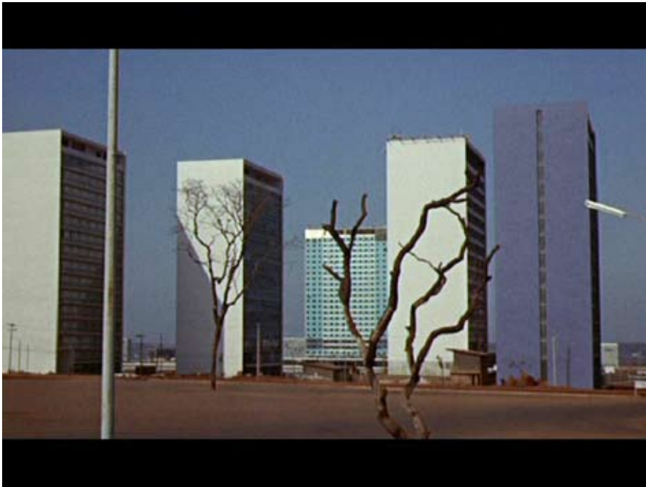
Os candagos [manufacturers] , Vidéo couleur DVPAL 4/3 letterbox, 8 minutes

J'ai commencé, à l'occasion de mon diplôme d'architecture en 2007, à récupérer auprès d'archives municipales des maquettes de concours d'architecture perdus. Le but est alors de les collecter sans tenir compte des programmes auxquels elles renvoient et d'engager une démarche de représentation libre où la cohérence des formes se substitue à celle du projet. Ce jeu de dislocation, construction et juxtaposition donne corps à un univers sculptural qui s'apparente à un grand projet d'urbanisme libéré de toute application rationnelle.