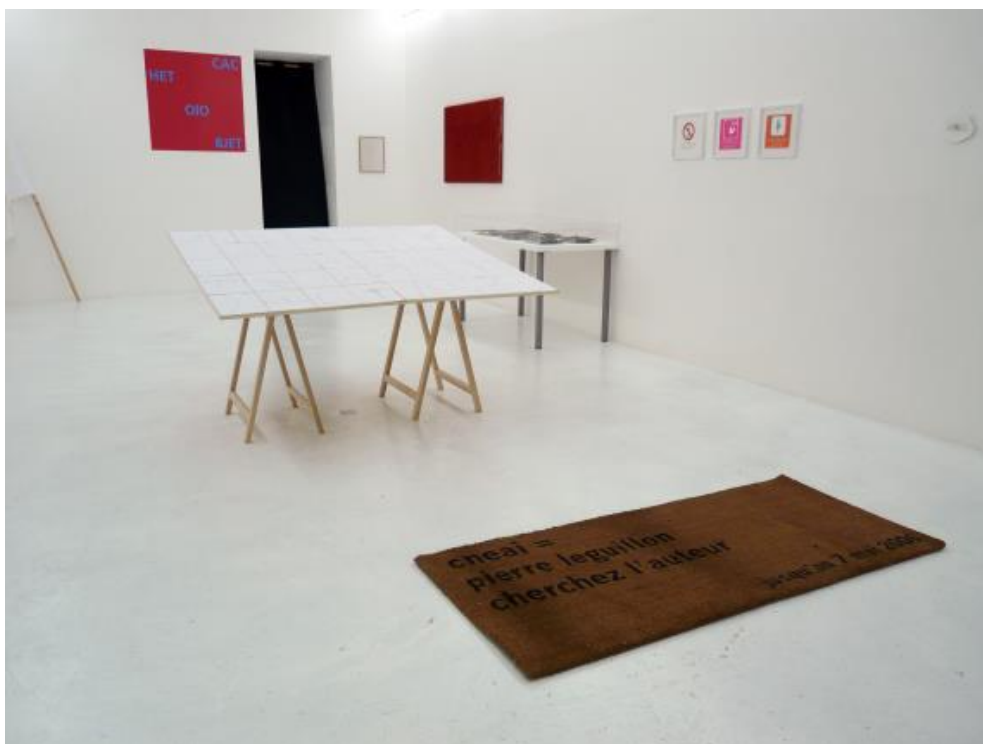
Vue de la galerie – Exposition collective Obsédés textuels , 2011

Repérée par les grandes instances publiques, la galerie est suivie par un public initié et par des professionnels de l'art contemporain. Toutefois, l'association porte les valeurs d'un service public et œuvre à rendre la création plastique plus accessible à tous. Ainsi, la galerie soutient-elle une politique de démocratisation et d'ouverture de l'art contemporain en touchant tous les publics par le biais de visites commentées gratuites, assurées par des médiateurs formés. Militant également pour la reconnaissance des droits des plasticiens, RDV est membre de la FRAAP (Fédération des Réseaux et Associations d'Artistes Plasticiens) et du Pôle Arts Visuels des Pays de la Loire.