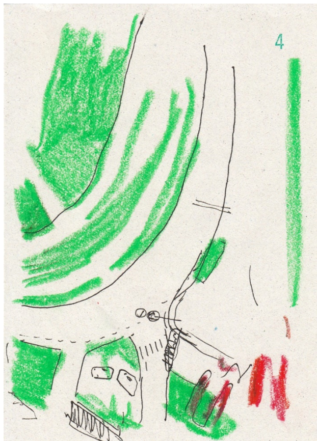
Annelly Boucher, Interstices.4 , encre et pastel gras sur papier, 2017