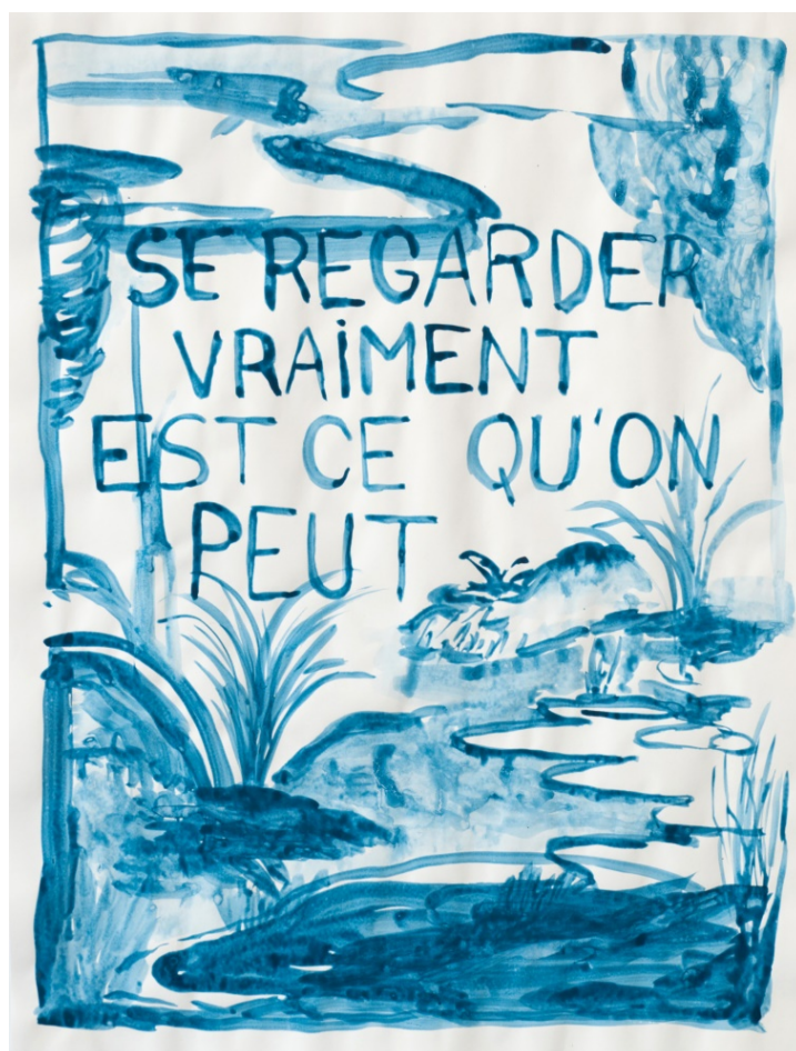
Annelly Boucher, Se regarder vraiment , gouache sur papier, 2017