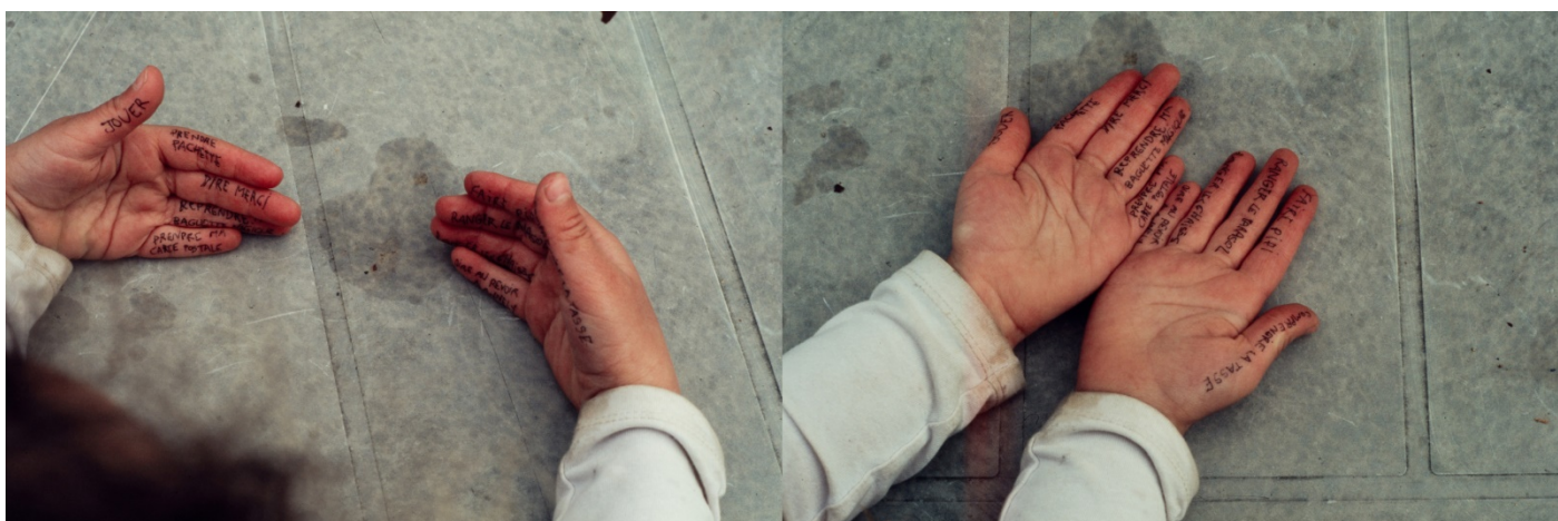
Annelly Boucher, O. les choses qui comptent , diapositive, 2014