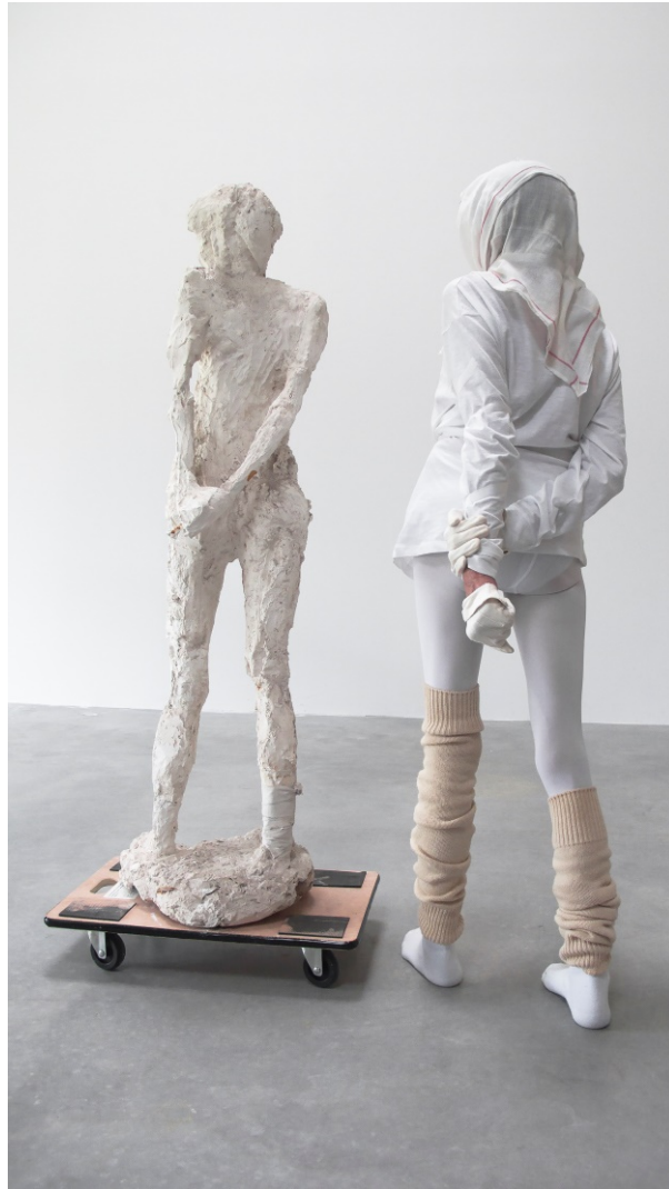
Jacqueline Gueux, Prendre la pose , photographie, 200 x 111 cm, 2016. Sculpture de 1964