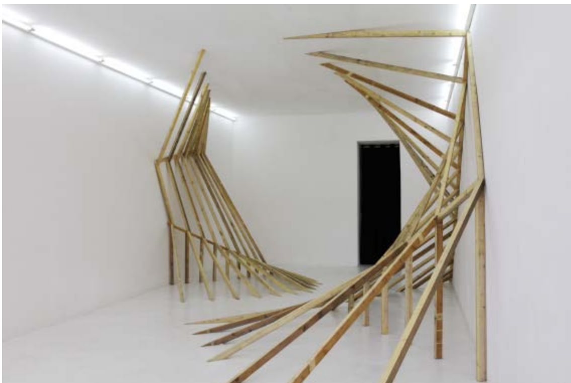
Vue de la galerie - Exposition CESIUM , 2012

Au-delà du plaisir et de la distraction qu'apporte la visite d'une exposition, RDV agit en faveur d'une place active et réfléchie de son public. Ainsi, une documentation en libre accès permet au public de s'informer sur les expositions, la galerie, les artistes présentés, les œuvres.