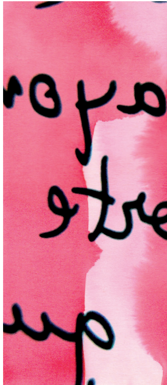
détail.

Quelque part, on peut sentir dans cette démarche le souci d'ouvrir, même discrètement, des espaces de rencontre et d'écoute. Une approche où répandre le doute, ouvrir des brèches dans les certitudes, serait déjà beaucoup.