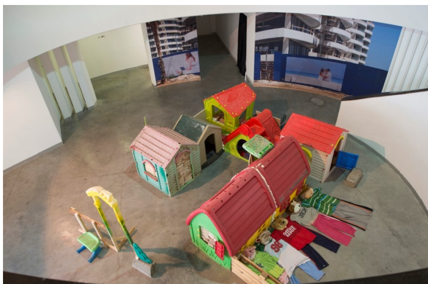
Francesco Finizio, Minimalia , maisons en plastique, briques et pierres taillées, objets en plastique, photocopies, fripes, 2015