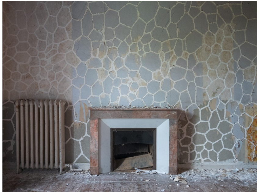
Stéfán Tulépo, Ecailles , photographies numériques sur aluminium, 80 x 60 cm, intervention sur papier peint et plâtre, 2018