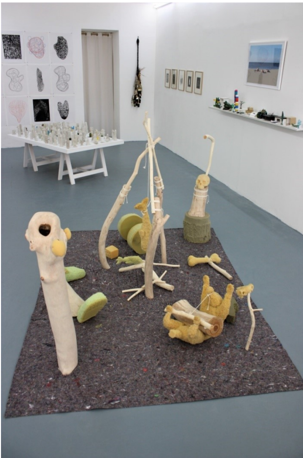
Vue de la galerie Exposition Résidences secondaires , 2018

Laboratoire d'expressions plastiques, RDV se construit en lien étroit avec son public : professionnels, initiés