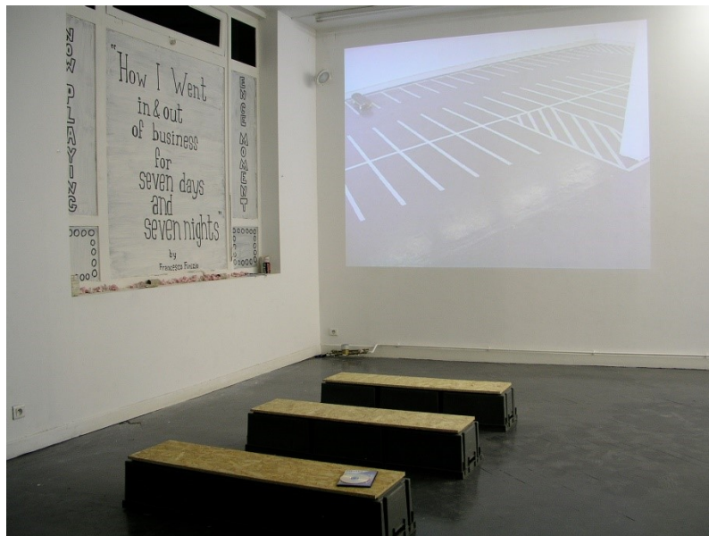
Francesco Finizio, How I Went In & Out of Business for Seven Days and Seven Nights , installation et projection en boucle d'un diaporama composé de 97 en images, 2008