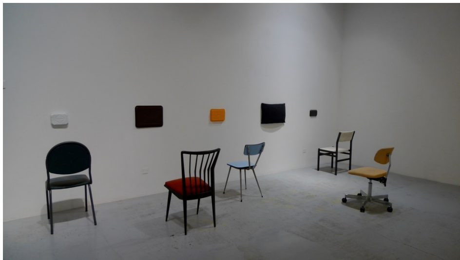
Francesco Finizio, Vision Center , chaises et collection d'objets rectangulaires trouvés (plateau, paillason, coussin etc.), 2012