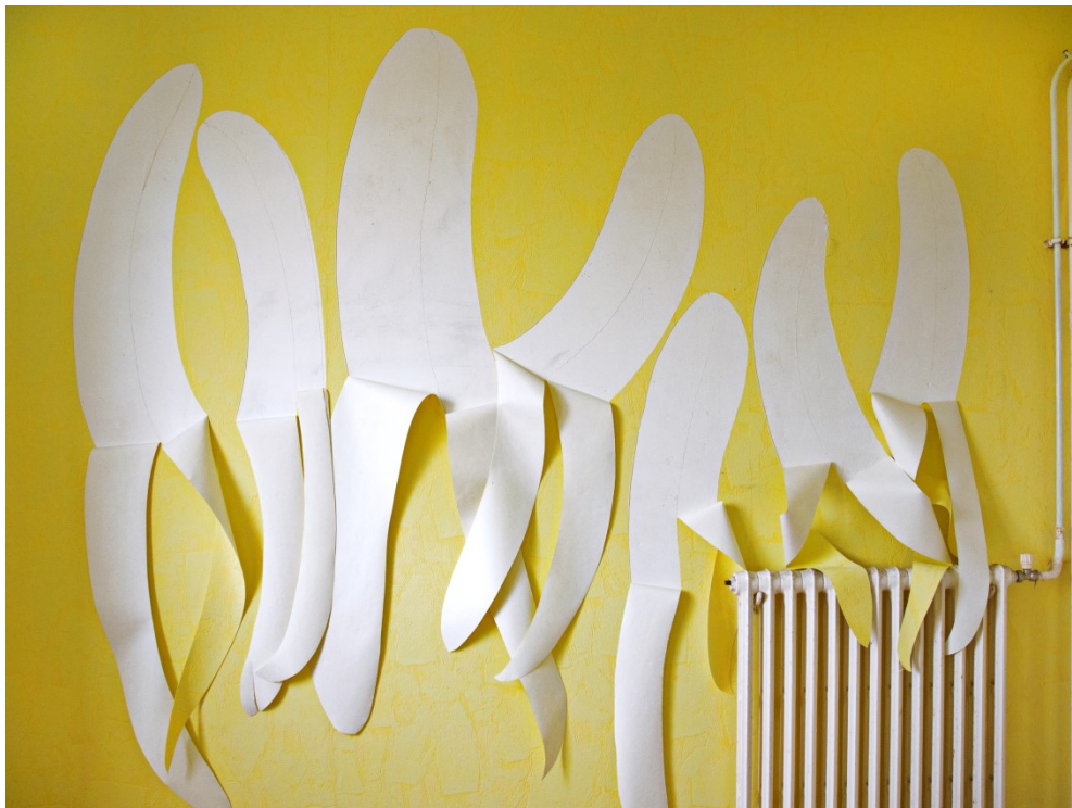
Stéfán Tulépo, Murisserie nationale , photographie, dimension variable, découpe de papier peint, 2014