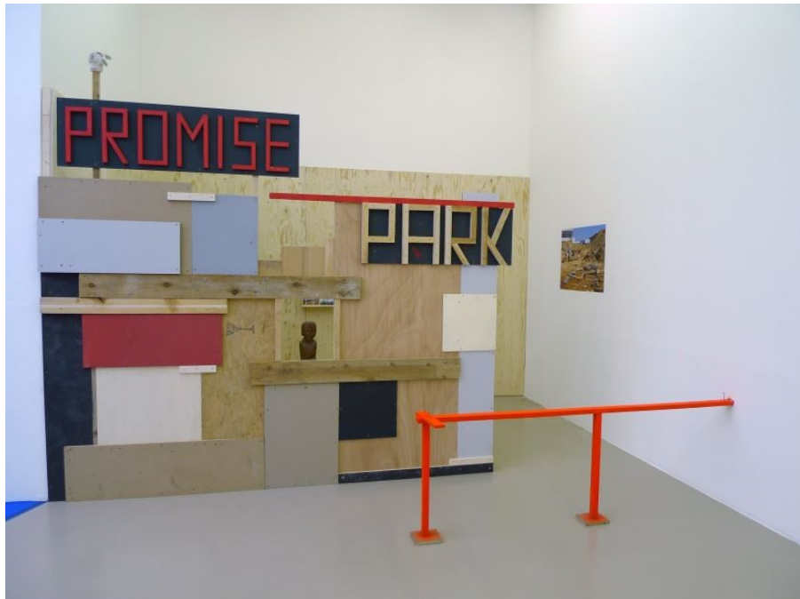
Francesco Finizio, Promise Park , installation (3 vidéos, cartes postales, tirage photographique, bois, peinture), 2015 ©Gal Deren