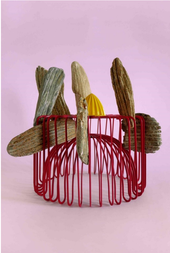
Stéfán Tulépo, Cactus n°11 , extrait de la série de photographies "Jardin", taille variable, assemblage de sculptures sur pierres sculptées et objets, 2018