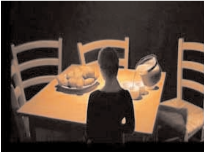
“ Les mangeurs de pommes de terre” 2007