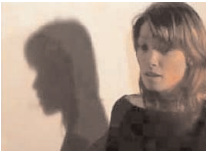
“ Screaming room “ 2006