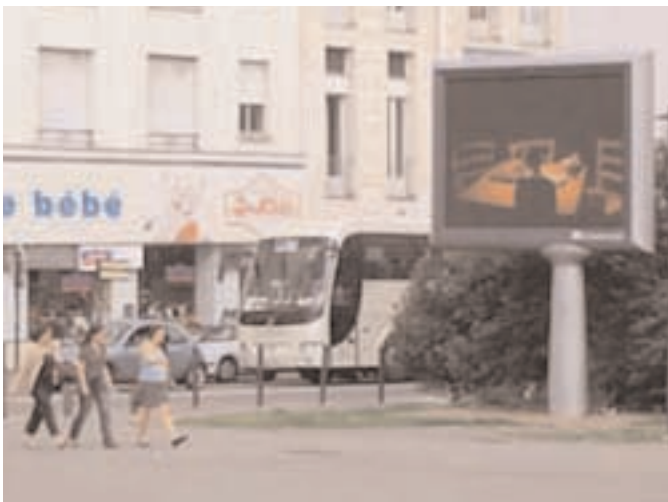
Mobilier urbain interactif "Info Nantes".

R_minute est une proposition du collectif R_.