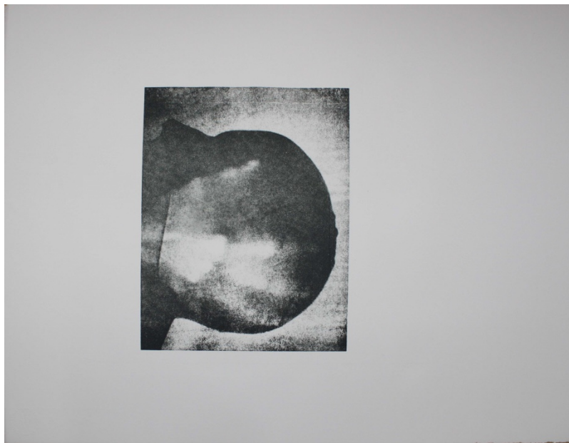
CÉCILE BENOÏTON, Le Bonnet de bain , 2018 Lithographie, création originale signée, tirage à 25 exemplaires 150€ avec poudre d'argent, 100€ non argenté

Se brosser les dents, maintenir un livre sous son bras... Cécile Benoiton construit ses vidéos à partir d'actes et éléments anodins qui forment notre quotidien. L'artiste compose un apparent minimalisme formel : par un plan fixe, resserré, elle focalise notre attention en une image au premier regard insignifiante. Le cadrage circonscrit notre champ de vision ; il produit ainsi un intérêt aigu pour cette prétendue trivialité filmée. Alors, un basculement général s'opère par le déplacement des normes : la brosse à dents est entourée de lèvres peintes d'un rouge vif ( Bleu blanc rouge ), l'accumulation invraisemblable de livres sous le bras s'apparente à une activité sportive figée ( Rodéo )... Ce décalage entre l'usuel et l'action réalisée par Cécile Benoiton provoque un chancellement, un déroutement. L'artiste ose, affirme le dépassement des habitudes sans aucun vacillement. Les vidéos ne proposent pas une expérimentation de nouveaux usages, chaque geste se déroule avec assurance, la tête de l'artiste est placée dans un plat tel une évidence ( Cocotte ).