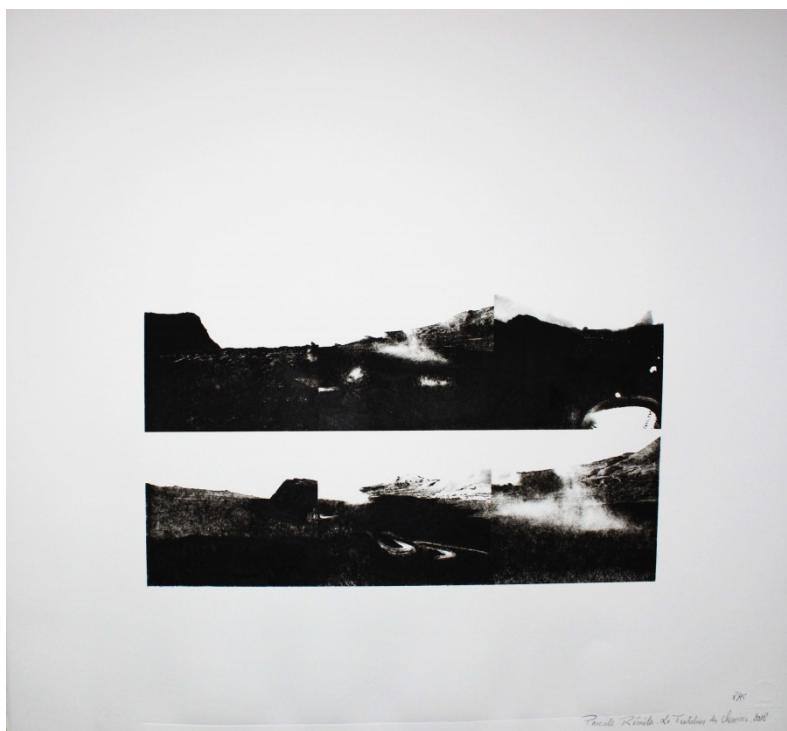
PASCALE RÉMITA, La tentation des chemins , 2018 Lithographie, création originale signée, tirage à 25 exemplaires 350€

« A l'intérieur de son travail plastique, l'artiste entreprend une déconstruction singulière et patiente des images et des flux actuels à l'œuvre dans notre société médiatique. ...Menées sur le mode de l'enquête impersonnelle, ses œuvres constituent autant de récits fragmentés et anonymes interrogeant notre rapport à l'image, à ses mobilités et ses persistances. De l'ordre rétinien ou mental, il s'agit bien là de questionner les statuts et les déplacements: ce que Benjamin appelait « l'inconscient de la vision ». La manière que possède notre regard de s'approprier et d'intégrer des représentations à travers une mémoire collective, personnelle et affective.