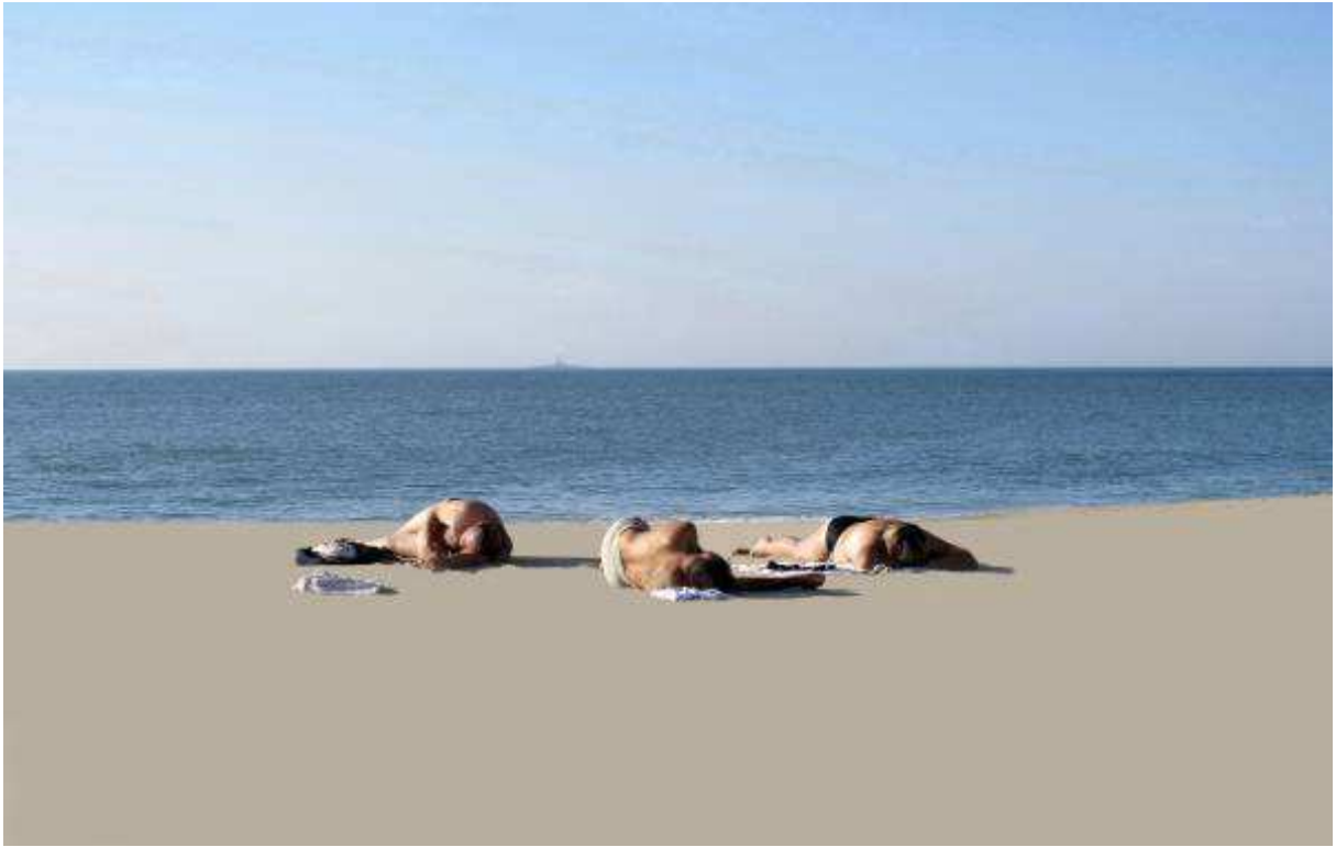
FREDERIC BONJEAN, LA PLAGÉ , 2017. PHOTOGRAPHIE INSTANTANÉE DE VACANCES. IMPRESSION SUR PAPIER, 70 X 50 CM