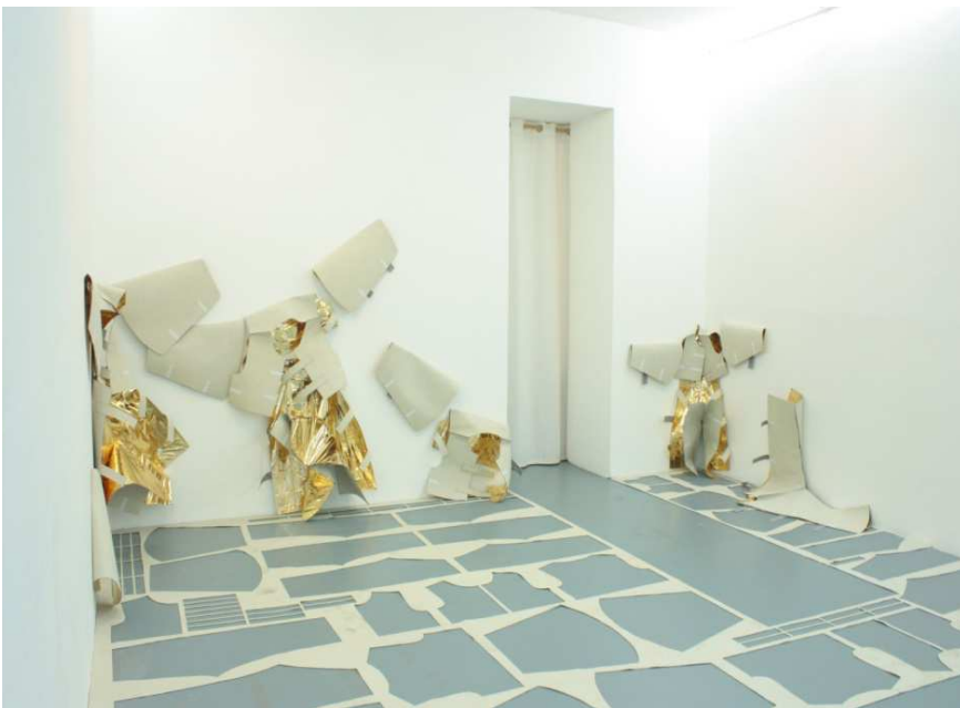
Vue de la galerie - Exposition [ aéRé ], 2017

Laboratoire d'expressions plastiques, RDV se construit en lien étroit avec son public : professionnels, initiés et amateurs. La galerie porte les valeurs d'un service public et œuvre à rendre l'art contemporain accessible à tous. L'entrée dans l'exposition est donc libre et des visites commentées sont régulièrement mises en place, pour les scolaires, étudiants en art, associations, personnes âgées, publics en situation de handicap, publics éloignés... Au-delà du plaisir et de la distraction qu'apporte la visite d'une exposition, RDV agit en faveur d'une place active et réfléchie de son public. Ainsi, quelques documents, catalogues et ouvrages permettent au public de s'informer sur les expositions, la galerie, les artistes présentés, les œuvres.