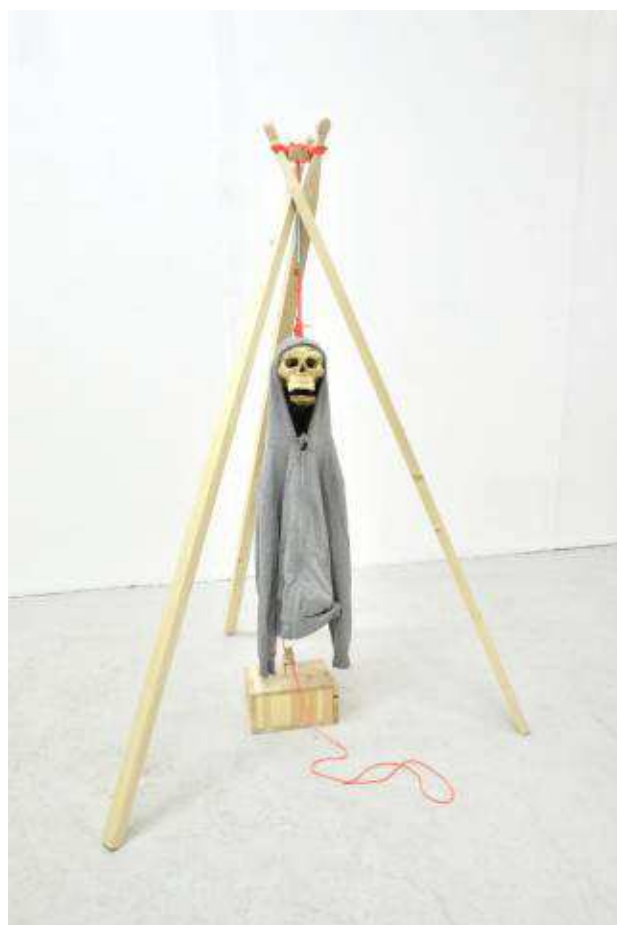
MATHIEU ARCHAMBAULT DE BEAUNE, SOLUTION N°1 , 2012. BOIS, METAL, BRONZE, FICELLE, TISSUS, RESSORT