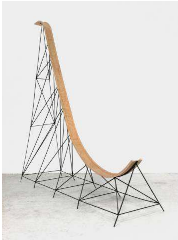
MATHIEU ARCHAMBAULT DE BEAUNE, LANCEMENT POUR DE VRAI N°1 , 2011. METAL, CONTREPLAQUE CINTRABLE