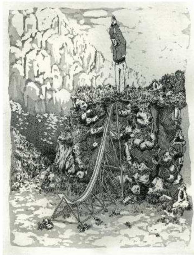
MATHIEU ARCHAMBAULT DE BEAUNE, LA RAMPE , 2013. GRAVURE A L'EAU-FORTE ET AQUATINTE SUR VELIN D'ARCHES