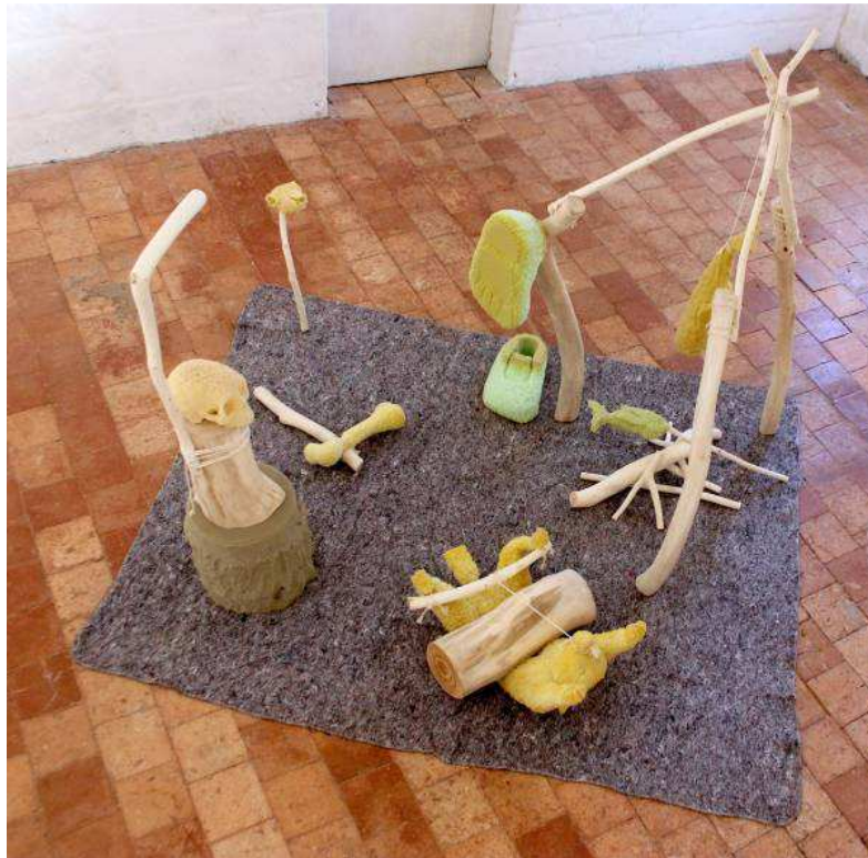
MATHIEU ARCHAMBAULT DE BEAUNE, LA GRANDE SYNTONIE , 2017. MOUSSE POLYURETHANE, BRANCHE DE PLATANE