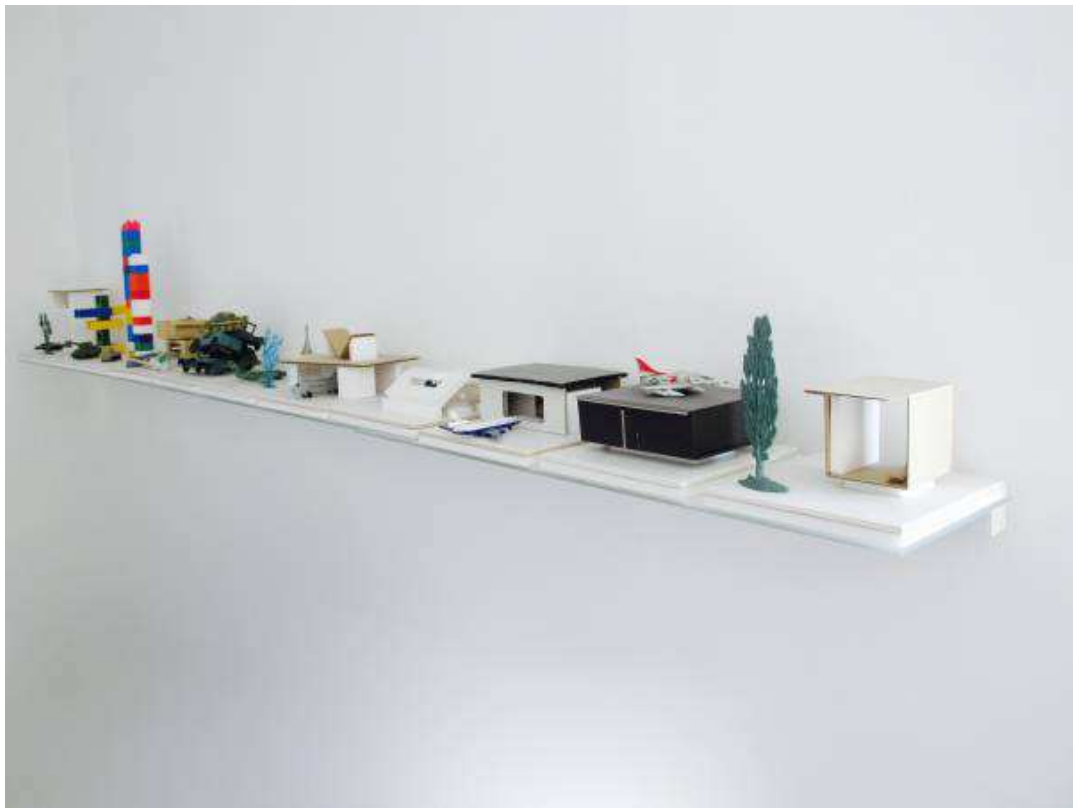
FREDERIC BONJEAN, RESIDENCES SECONDAIRES , 2017. TECHNIQUE MIXTE, 230 X 20 CM