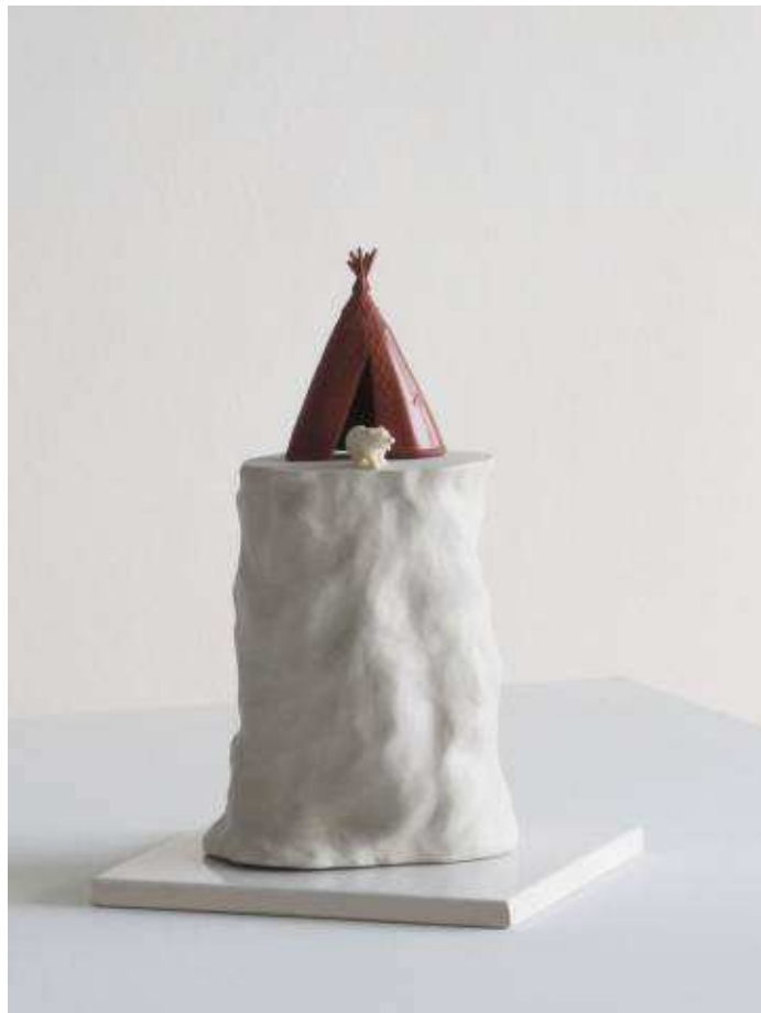
FREDERIC BONJEAN, LA BANQUISE , 2017. TERRE BLANCHE, JOUETS, FAÏENCE. 20 X 20 CM. H. 27 CM