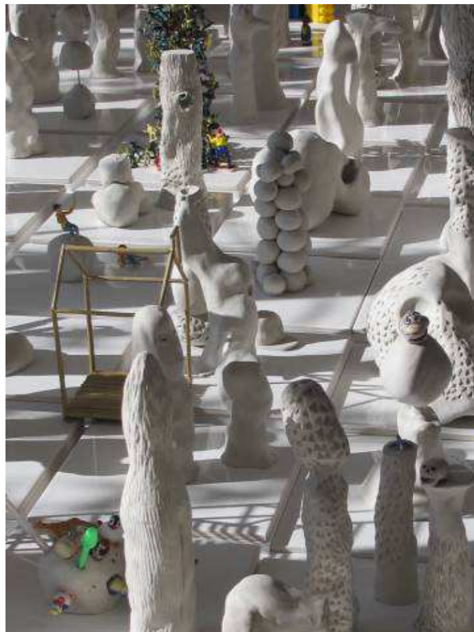
FREDERIC BONJEAN, ELEMENTS VERTICAUX ET DEBOIRES NATURELS (PARTICULES ELEMENTAIRES) , 2017. INSTALLATION 300 X 120 CM. MODELAGES EN TERRE BLANCHE, CARREAUX DE FAÏENCE BLANCS, 20 X 20 CM.